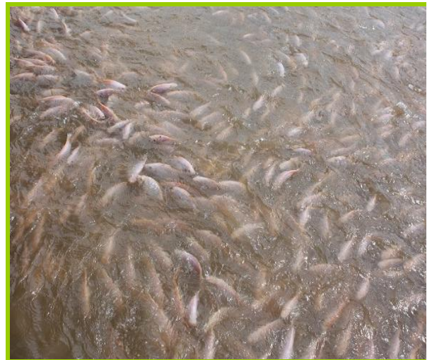
Ao cá rô phi