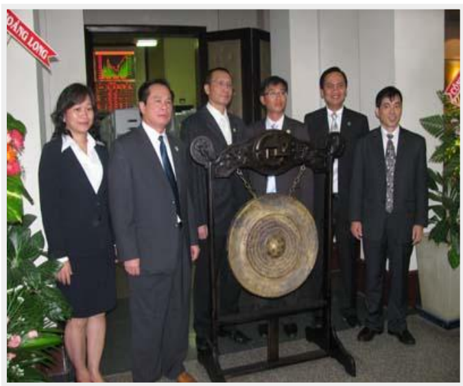
Hoàng Long niêm yết trên HOSE