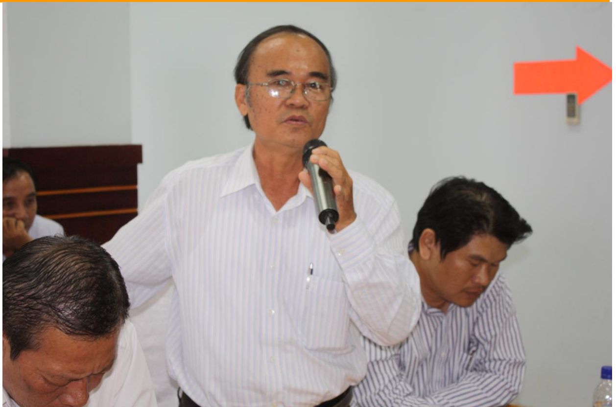
Hội nghị khách hàng