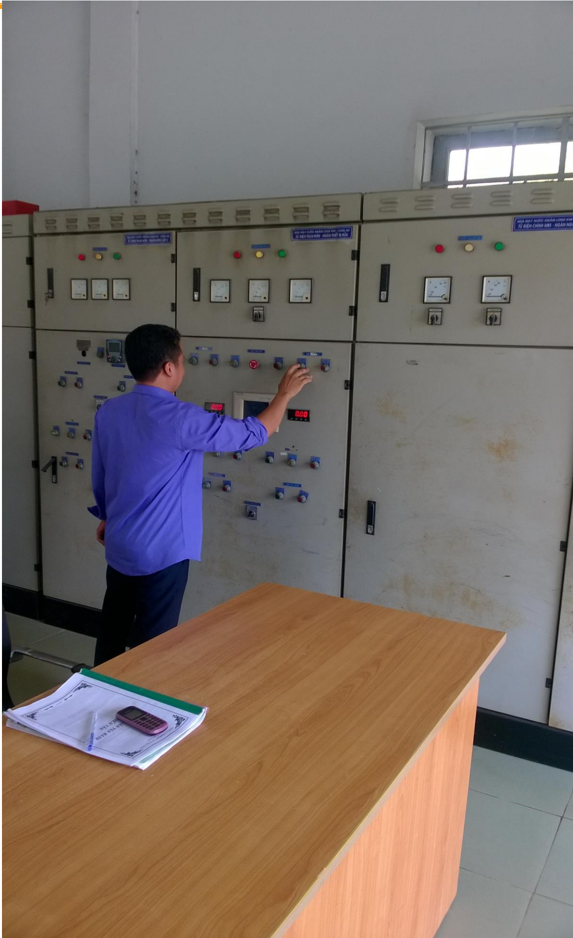
Nhân viên đang kiểm tra Hệ thống điều khiển nhà máy Nước