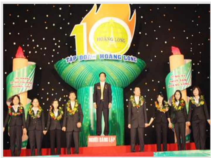
Lễ kỷ niệm Tập đoàn Hoàng Long 10 tuổi