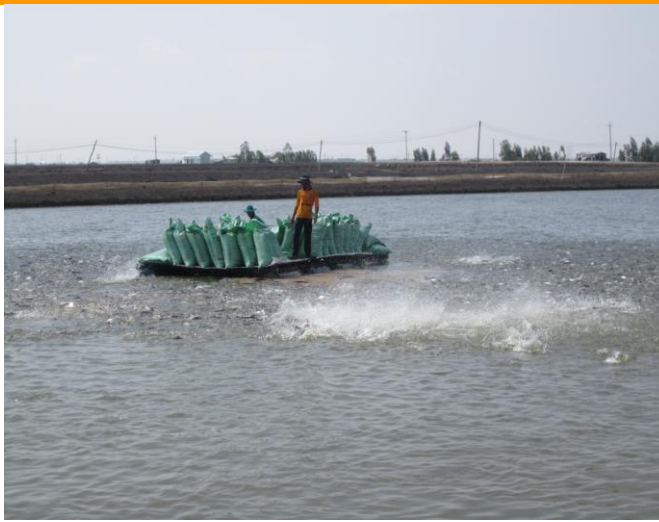
Ao cá tra