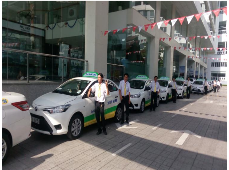
Taxi Sài Gòn Hoàng Long nhận bàn giao xe mới

Năm 2015 hoạt động kinh doanh của Taxi Sài Gòn Hoàng Long còn gặp nhiều khó khăn do sự cạnh tranh gay gắt của các doanh nghiệp có qui mô đầu xe lớn và sự xuất hiện cạnh tranh không lành mạnh của taxi Uber, Grap. Sự cạnh tranh giành khách trên thị trường vốn là sự tồn tại có sẵn trong kinh doanh mà doanh nghiệp nhỏ phải đương đầu nhưng sự bùn nỏ về số lượng xe của các hãng lớn cũng như Taxi Uber, Grap khiến tài xế đã thiếu nay càng thiếu hơn. Đây là yếu tố ảnh hưởng không nhỏ đến doanh thu của công ty vì tỷ lệ xe hoạt động bị giảm xuống.